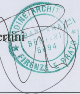
Tavola n° 5