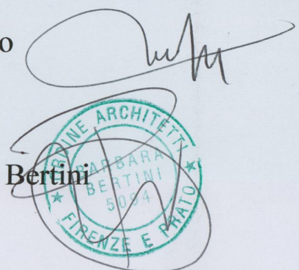
Tavola n° 6