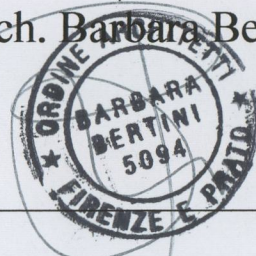
Tavola n° 10