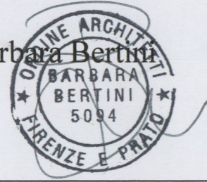
Tavola n° 2