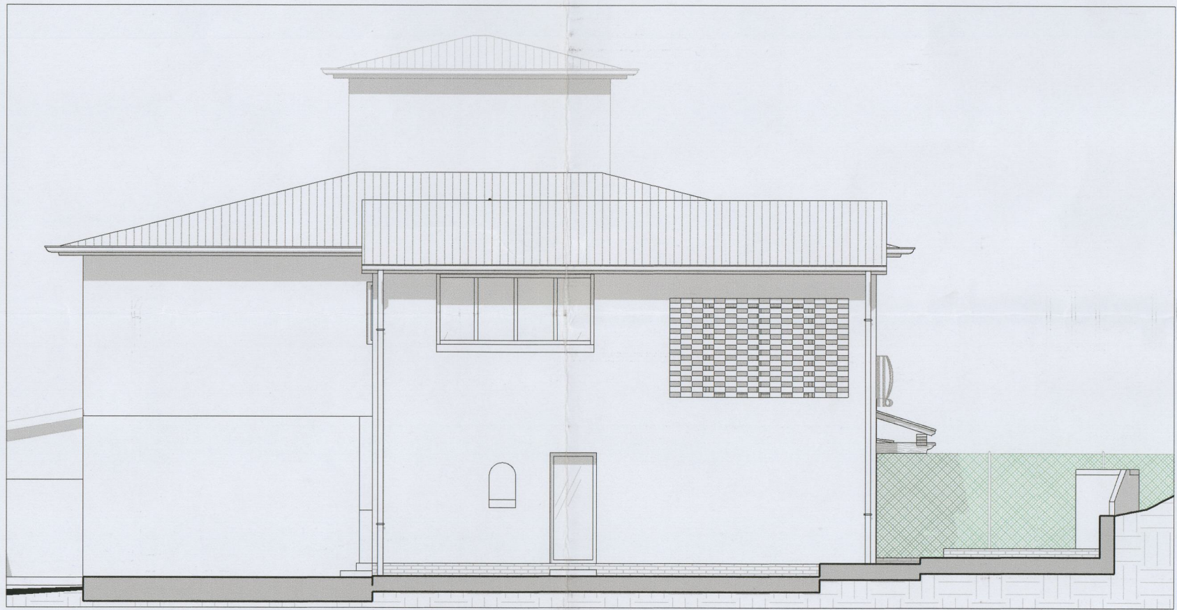
Prospetto Sud-Est - stato futuro