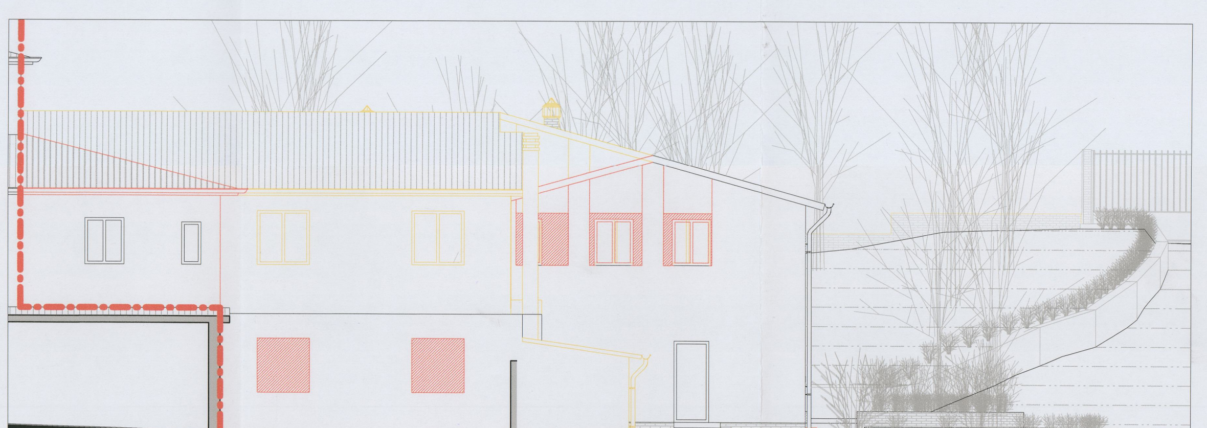
Prospetto Sud-Ovest - stato sovrapposto