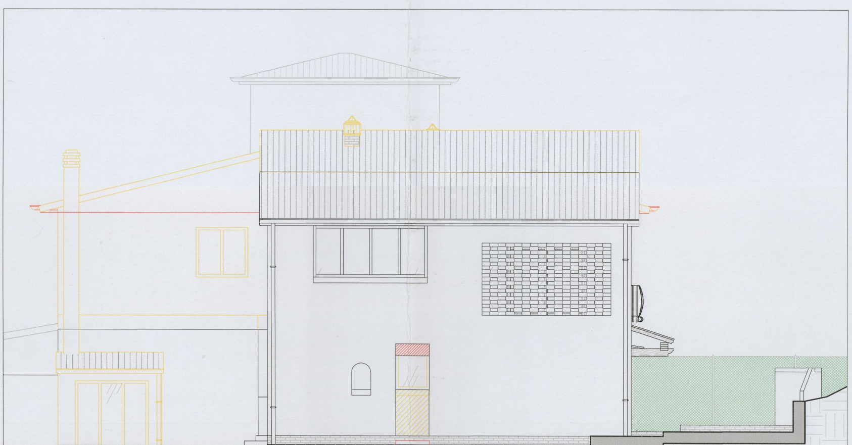
Prospetto Sud-Est - stato sovrapposto