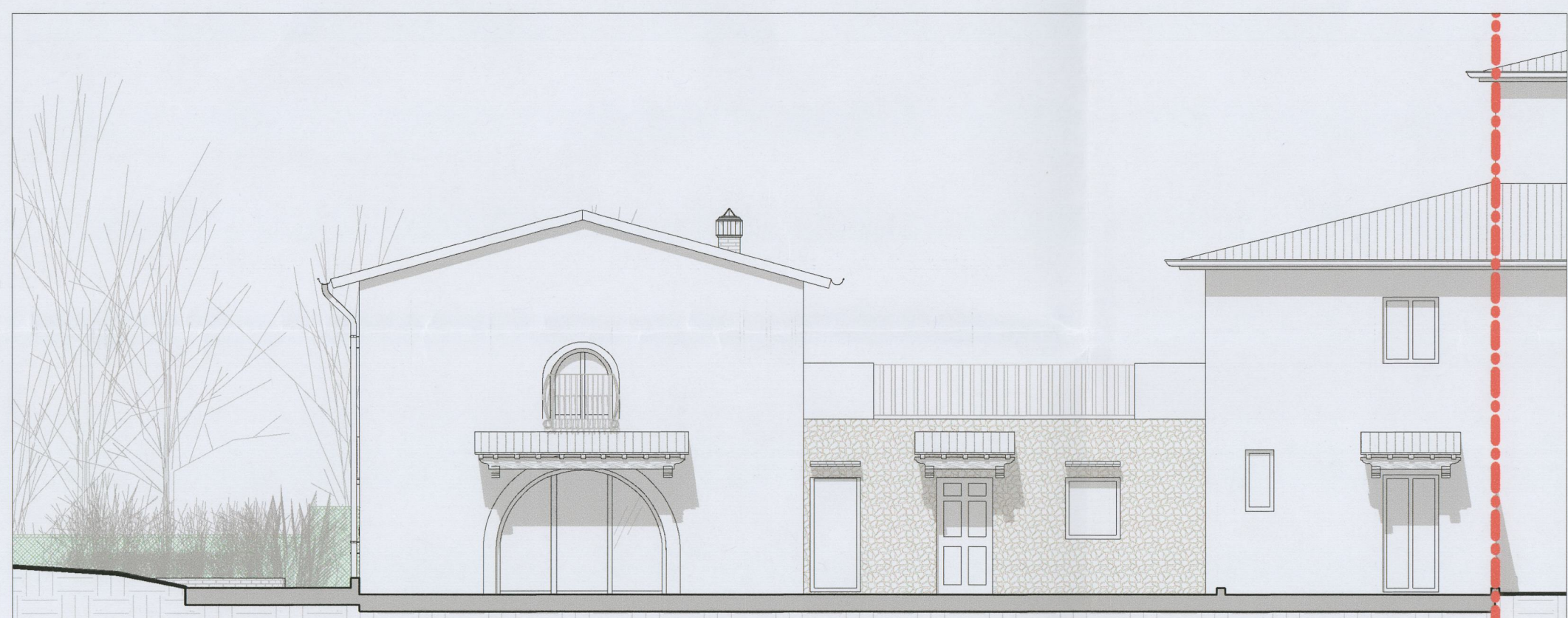
Prospetto Nord-Est - stato futuro