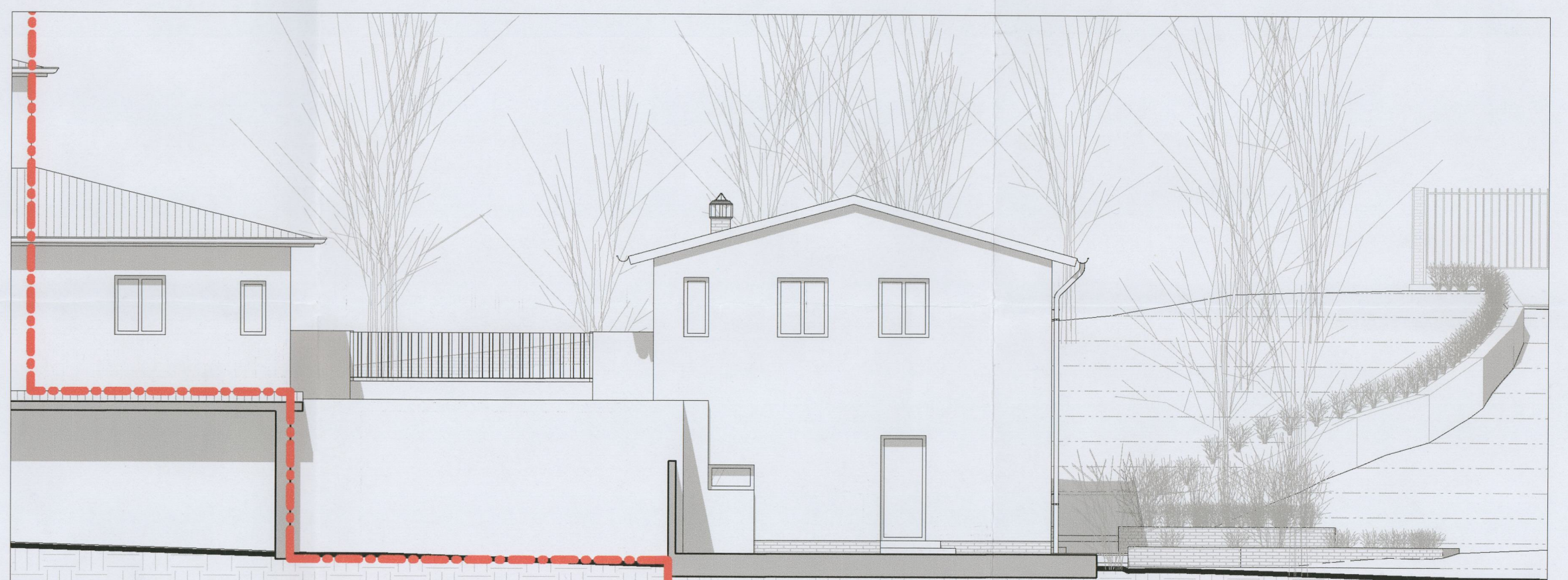
Prospetto Sud-Ovest - stato futuro