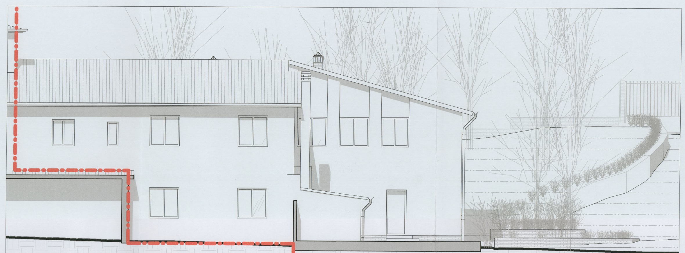
Prospetto Sud-Ovest - stato attuale