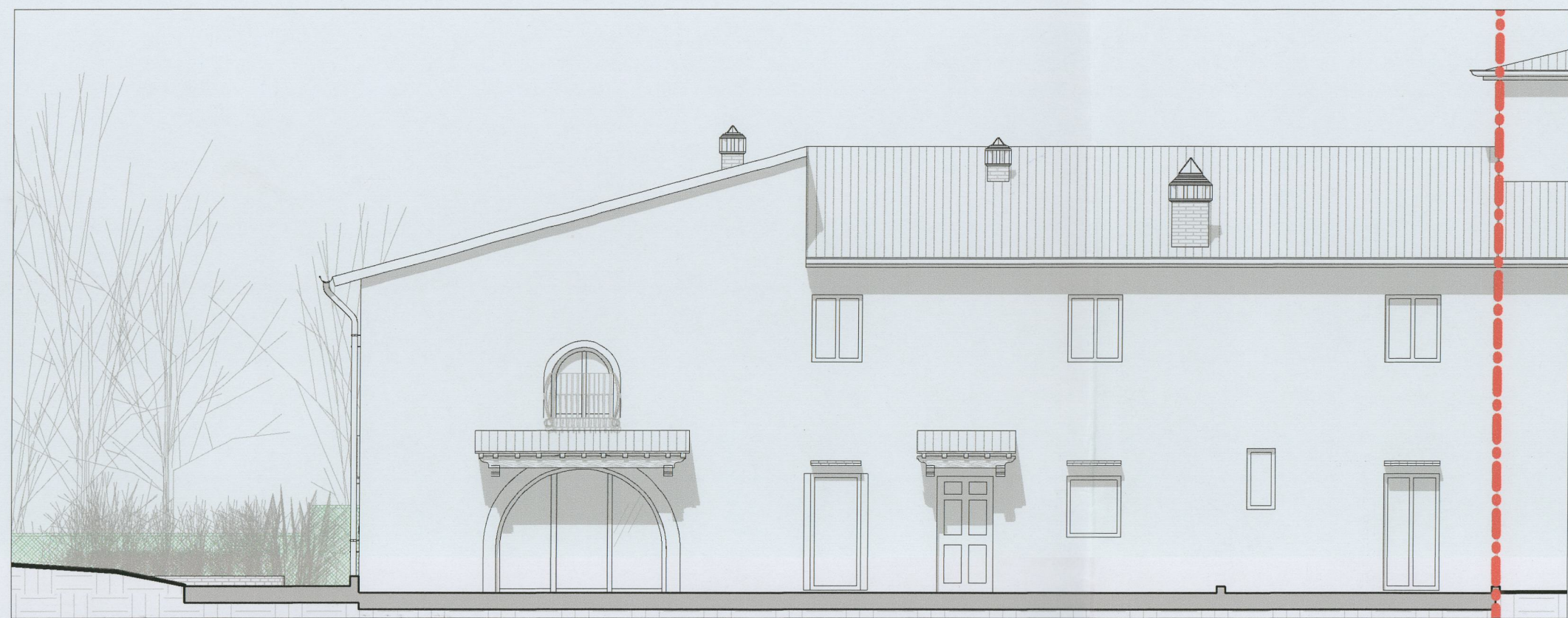
Prospetto Nord-Est - stato attuale