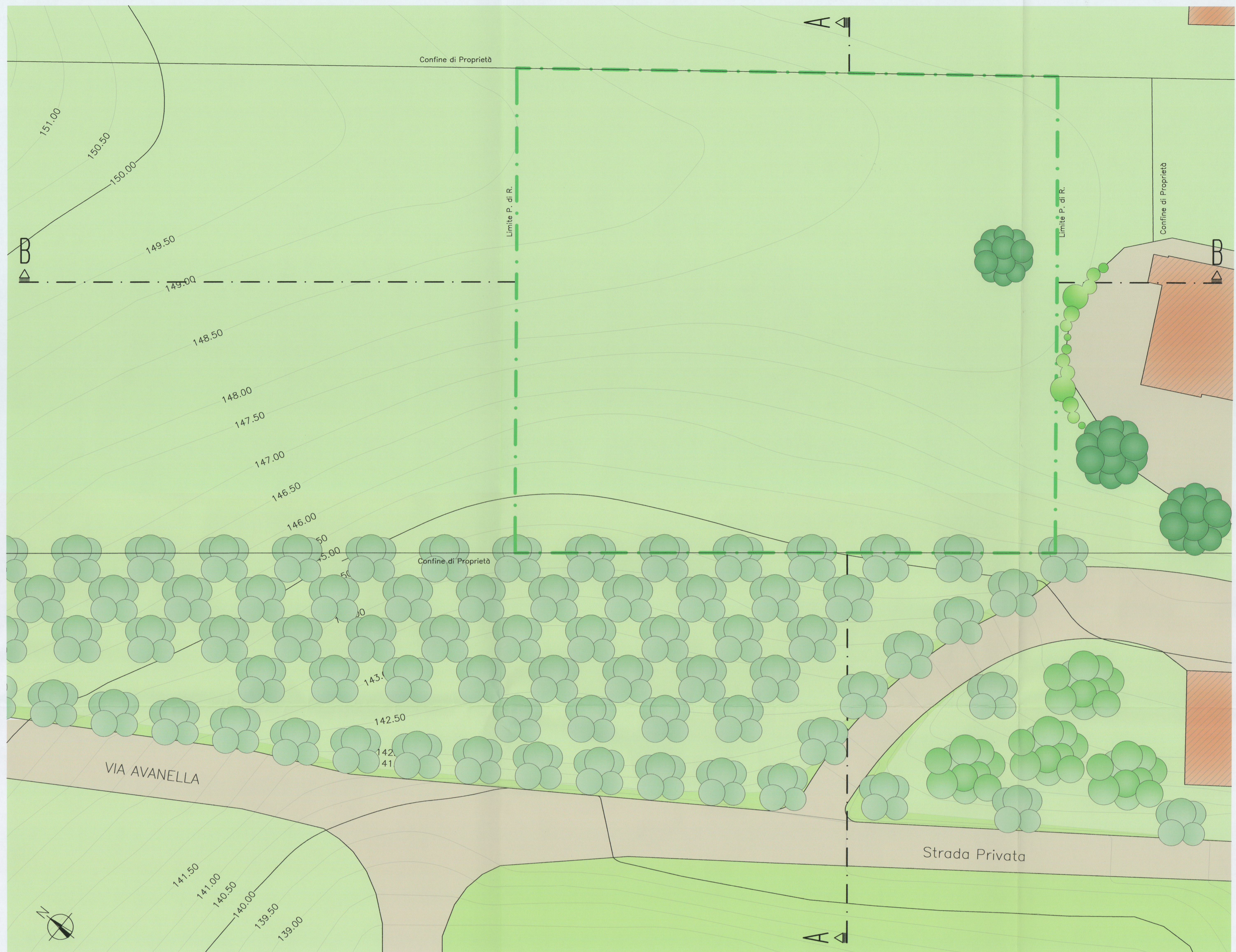
PLANIMETRIA GENERALE EQUIDISTANZA CURVE DI LIVELLO m 0.50