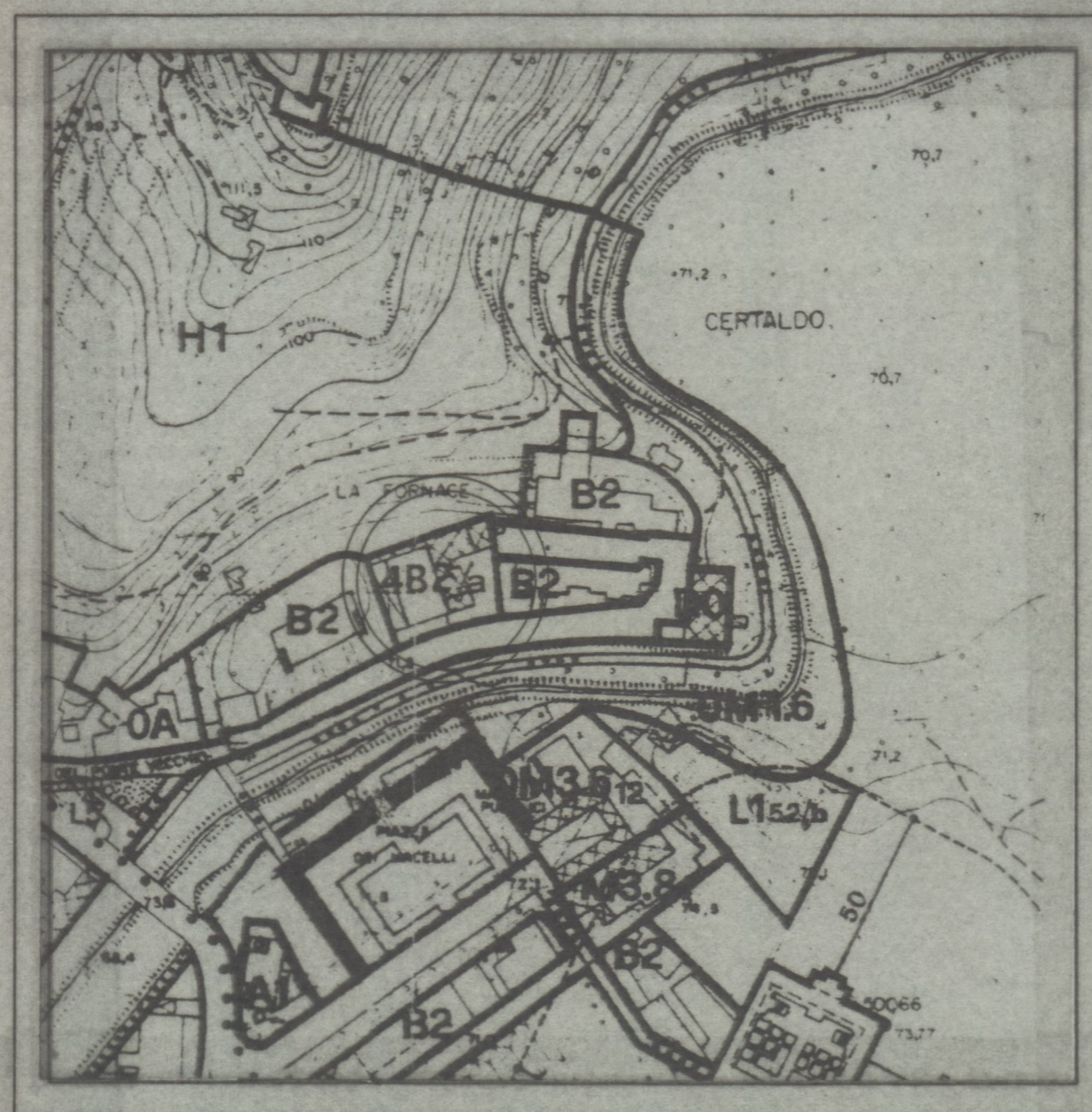
PIANO REGOLATORE GENERALE ZONA 4B2/a

STUDIO : Viale G. Matteotti n°103 - 50052 CERTALDO (FI) Tel. 0571/652395 Fax. 0571/667360 e-mail: studiocinelli@libero.it