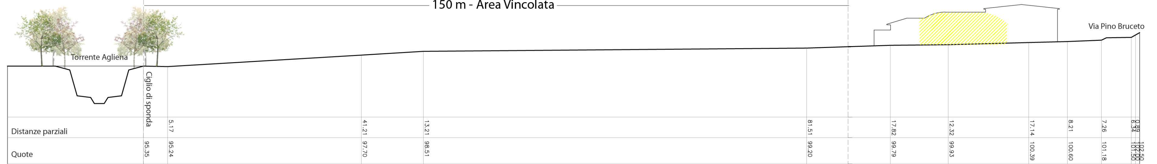
Sezione A-A scala 1:500 150 m - Area Vincolata