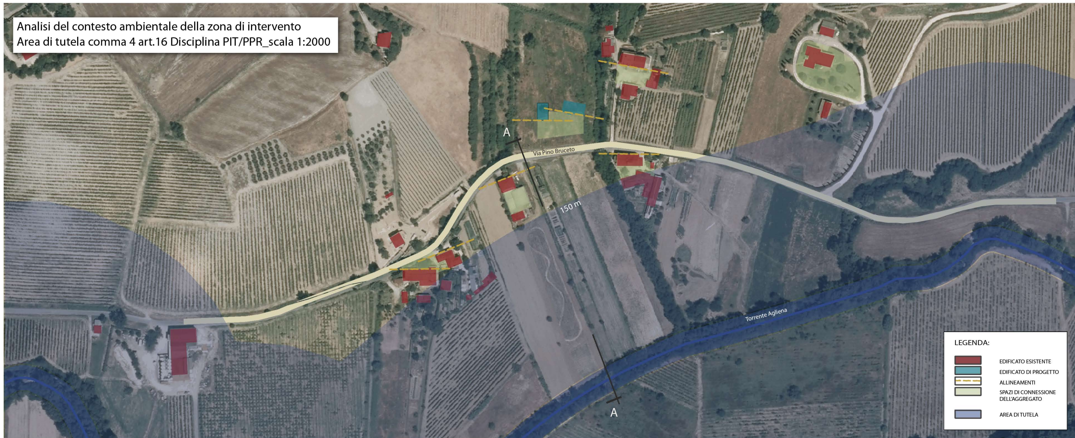
Analisi del contesto ambientale della zona di intervento Area di tutela comma 4 art.16 Disciplina PIT/PPR_ scala 1:2000

30028 Tavarnelle Val di Pesa - via Naldini 3, - Cod. Fisc. / P. iva 04128670488 Tel./Fax 055/8076378 - martini.conti@bec.lin.it