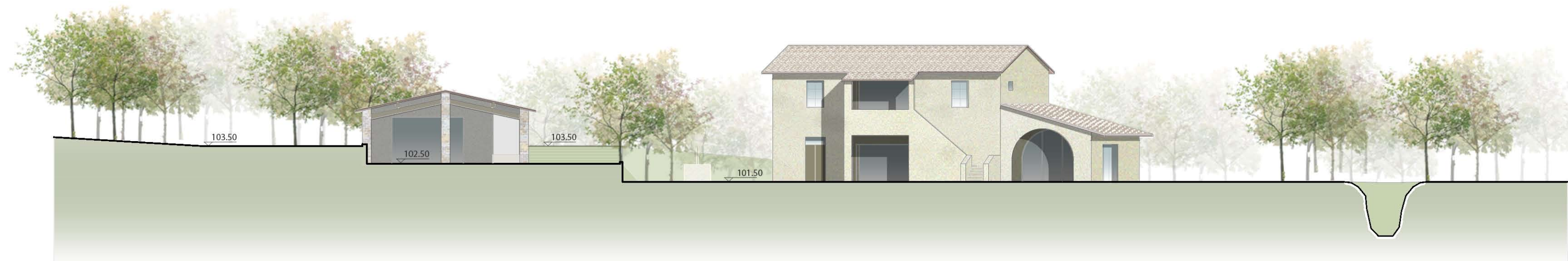
Sezione A-A_scala 1:200