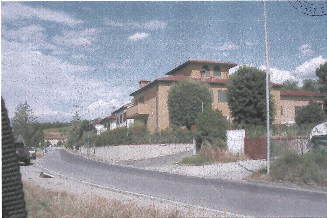
VEDUTE DA VIA FIORENTINA