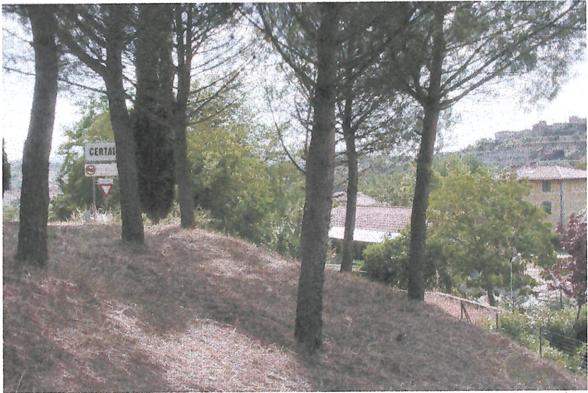
VEDUTA DA VIA CALCINAIA