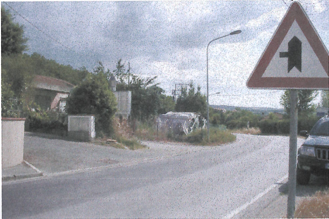
VEDUTA DELL'INGRESSO DA VIA FIORENTINA