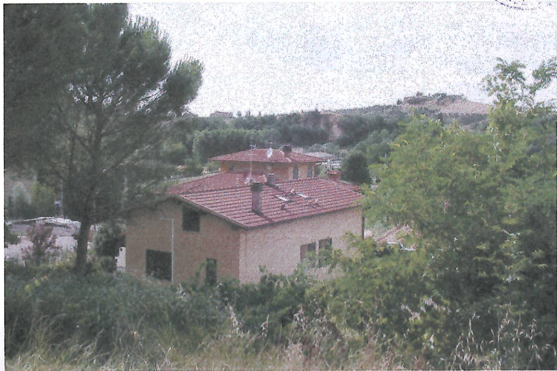
VEDUTE DA VIA CALLINAIA