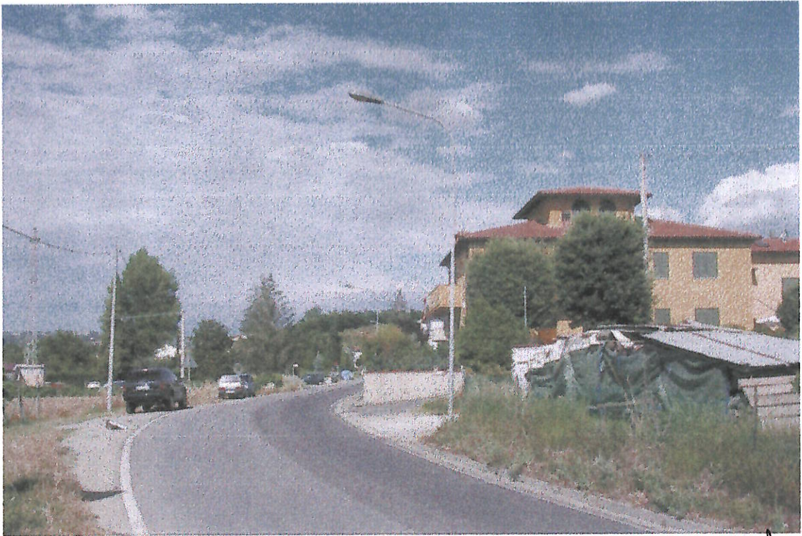
ANCORA UNA VEDUTA DA VIA FORENTI