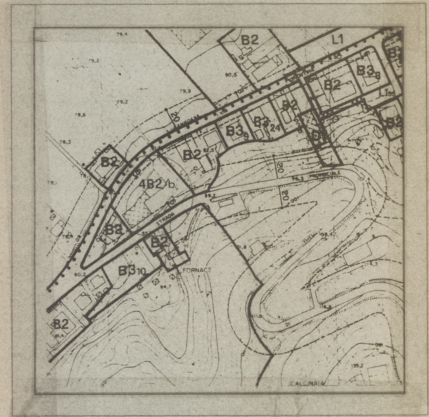
ESTRATTO P.R.G. ZONA 4B2/b