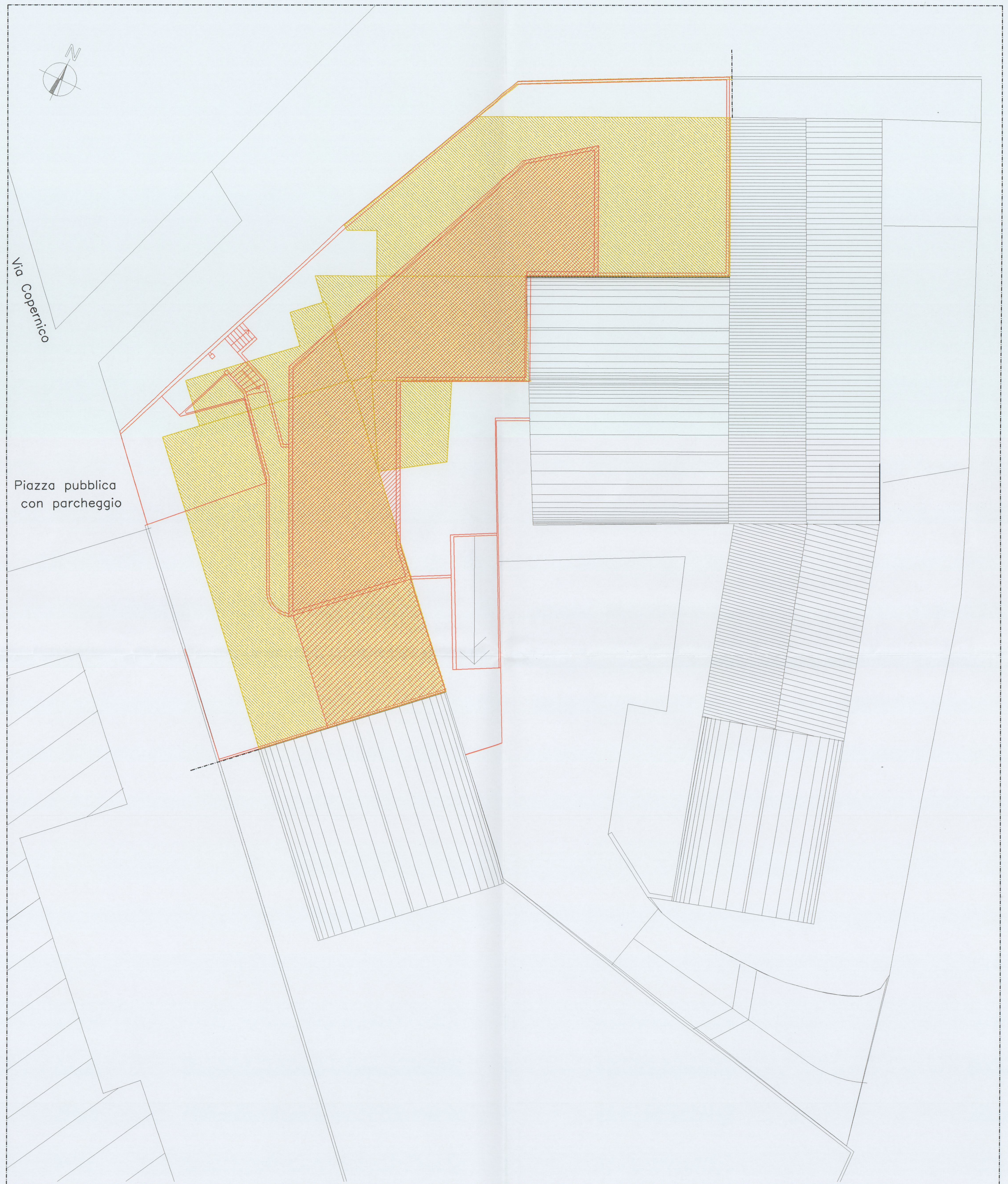
PLANIMETRIA SCALA 1:200