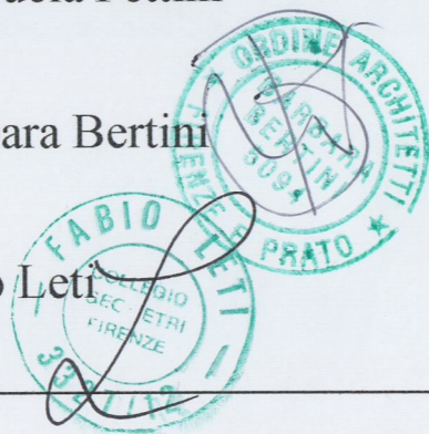
Tavola n° 12 Tav. integrativa richiesta con prot. n° 7275 del 6/4/2005