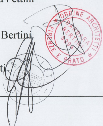
Tavola n° 2

Planimetria Generale attuale con inquadramento del Comparto del P.R.G.C. Scala 1:500