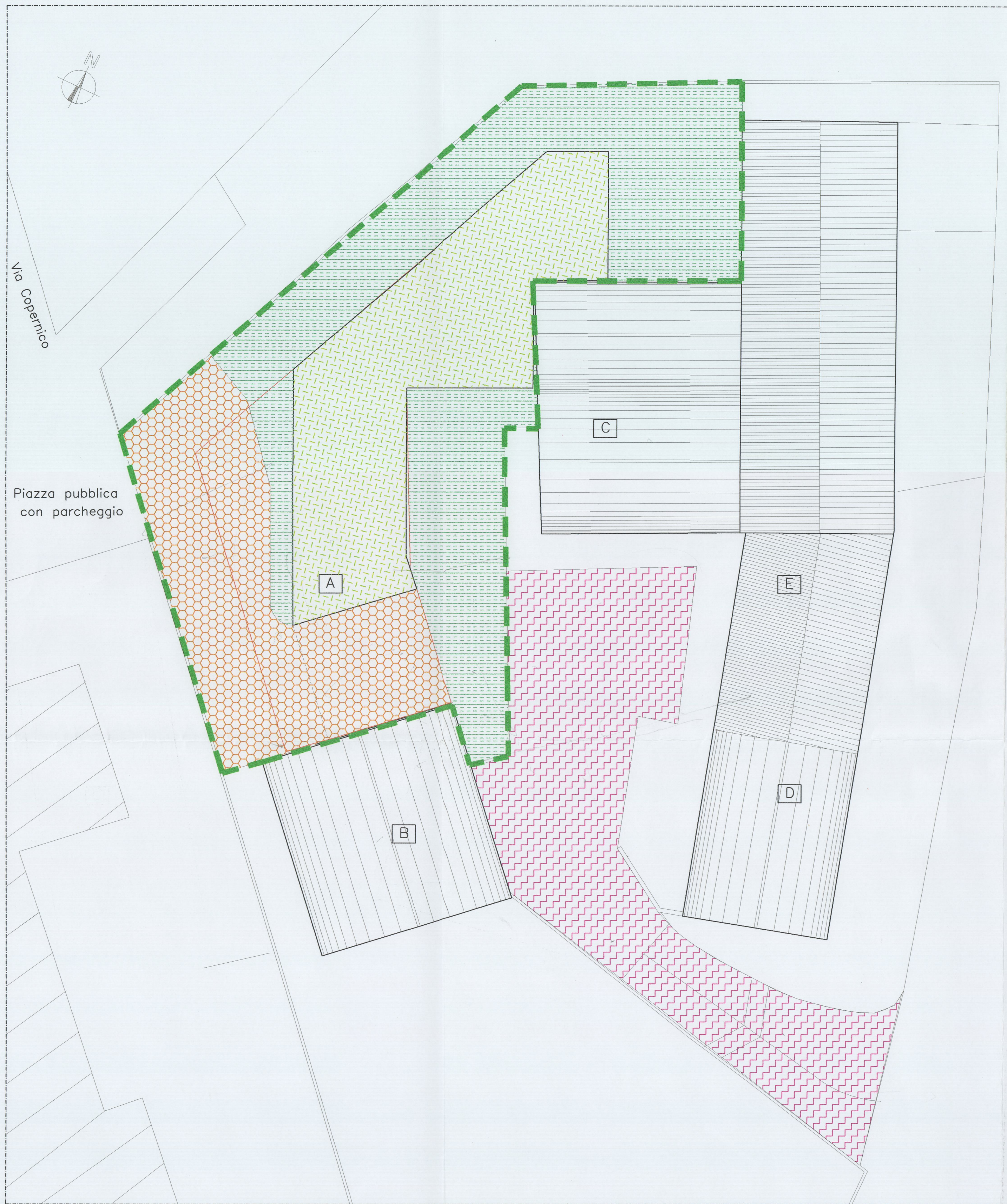
PLANIMETRIA GENERALE PIANO TERRA SCALA 1:200

Dott. Arch. Barbara Bertini - Geom. Fabio Letti - Roberto Giovi - Roggero Trentanovi - C.F. e P.IVA 0419085 048 9 Viale Giacomo Matteotti, 60 - 50052 CERTALDO (FI) - Tel. 0571/652208 Fax 0571/637714 - E-mail apogeo@libero.it Piazza Ugo Copernico, 20 - 50021 BARBERINO V.E. (FI) - Tel/Fax 055/8075210 - E-mail studioapogeo@libero.it